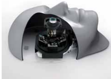
Bilder 2a und 2b: Im Patienten-Modellkopf des Operationsimulators wird optisches Echtzeit-Tracking auf kleinstem Bauraum umgesetzt

die 3D-Koordinaten der farbigen Instrumentenspitzen präzise bestimmt werden. Dazu erfolgt auf dem FPGA der Multisensor-Kamera zunächst eine Synchronisation und parallele Vorverarbeitung der pixelsynchronen Bilddaten. Der verlustfrei komprimierte Datenstrom wird über ein einziges USB-Kabel an den Computer weitergeleitet, wo die Auswertung der Daten erfolgt. Eine Blobsegmentierung liefert die 2D-Koordinaten für jeden Farbmarker. Daraus werden die präzise Lage und Ausrichtung des Modellauges und der Instrumente in 3D rekonstruiert. Biomechanische Simulationsalgorithmen berechnen das Gewebeverhalten bei Berührung durch die Instrumente in Echtzeit, so dass die virtuelle Operation ohne wahrnehmbare Verzögerung auf den OLED-Displays des Stereomikroskops abgebildet werden kann.